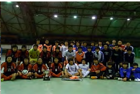
地域スポーツ振興にフットサル大会を開催