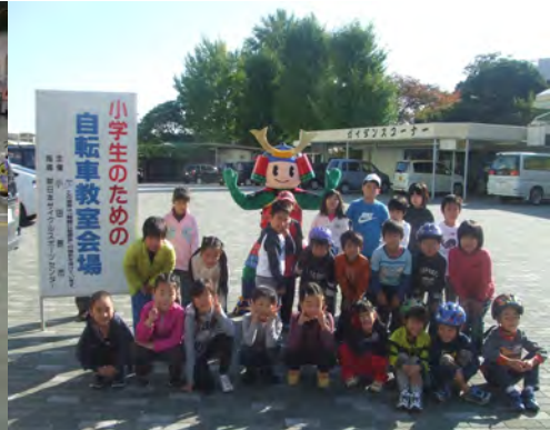
場外 小田原市の自転車教室