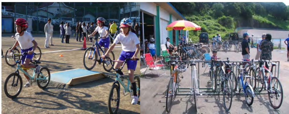
地元伊豆市内の月ヶ瀬小学校

本センターの所有する施設と人材を活用して、ロード・トラック・MTB・BMXの競技体験プログラムを提供する。なお、その実施にあたっては、小中学生コースと一般愛好者コースを設け定期的を開催し、自転車競技愛好者の拡大を図る。