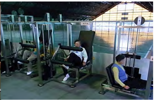
特定高齢者への筋力トレーニング