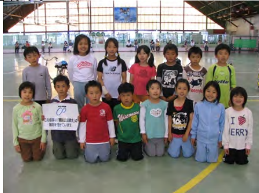
場内 小学生の自転車教室

自転車に乗れない女性と小学生を対象に、自転車の乗車技術を習得させるための教室を開催して自転車愛好者の底辺拡大を図る。また、競輪場を会場とする各自治体主催の自転車教室へも指導者を派遣し、積極的に協力を行う。