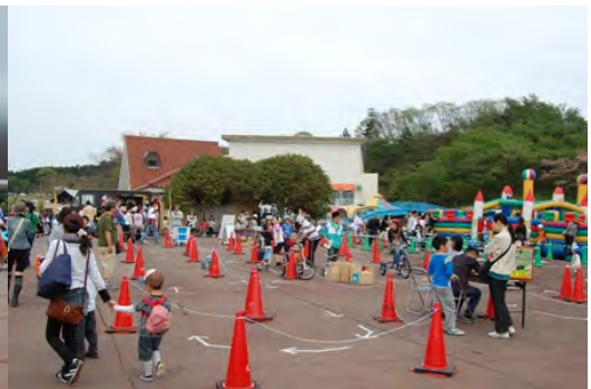
8月のサイクルカーニバルでサイクルフィギアの演技 GWのサイクルカーニバル 三輪車T.Tイベント