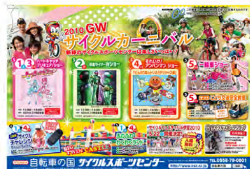
GWサイクルカーニバルのポスター

オ・新聞・雑誌等の媒体を使用した広告やチラシ等印刷物の作製・配布、各種案内看板の掲出等によって実施する。