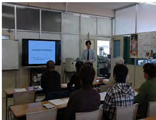
競技者指導者養成講習会

トラック・MTBコース・BMXコース等のNTC自転車競技強化拠点の諸施設を活用し、競技者育成のためのキャリアアカデミーや競技指導者育成のための養成講習会を開催し、自転車競技力の向上を図る。