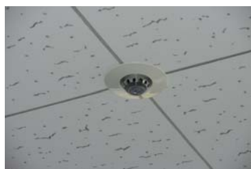
スプリンクラー（閉鎖型：湿式）