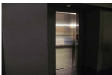
エレベーター（13人乗）

規模：最大収容人員 4,500人、観客席 1,800席（最大3,000席まで増設可）