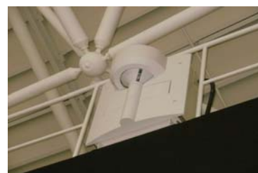
火災感知器・内蔵型放水銃（6台）