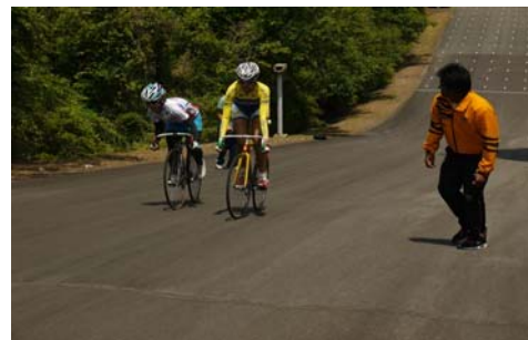
訓練施設の登坂走路