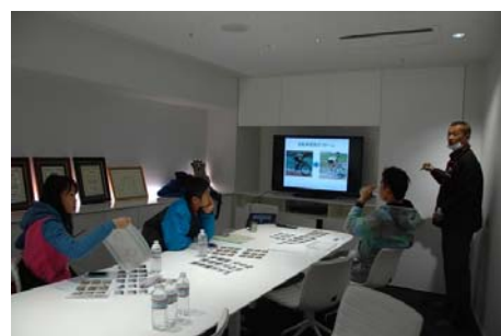
トレーニング効果を解説