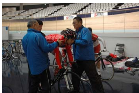
乗車フォーム・ペダリング修正