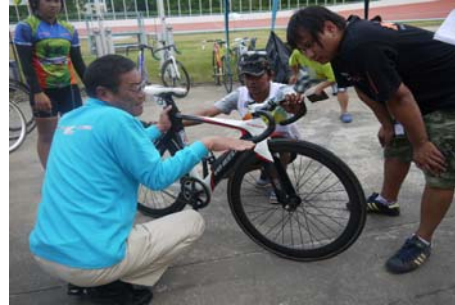
メンテナンス風景