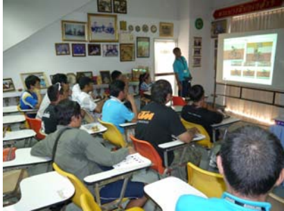
乗車フォームの解説