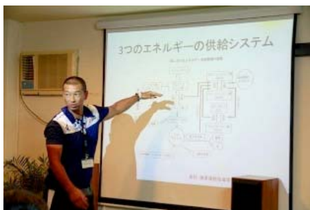
エネルギーの供給システムの解説