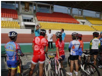
トラック実技指導