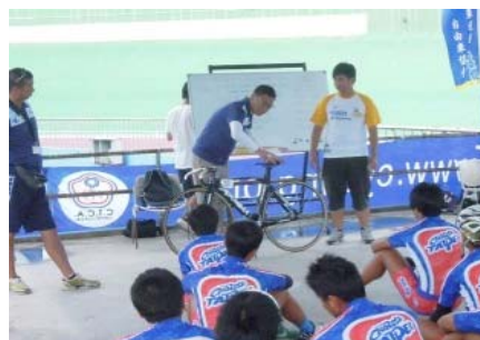
乗車フォームの解説