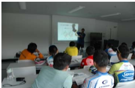
トレーニング効果を解説

内訳(香港チャイナ：選手2名、チャイニーズ台北：選手4名・コーチ2名、マレーシア：選手8名・コーチ2名、タイ王国：選手2名、インド：選手3名)