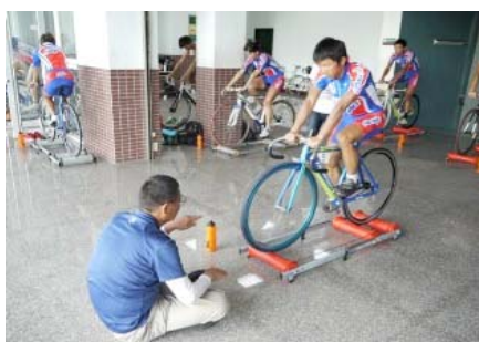
ローラー訓練ペダリング修正