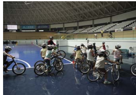
木製トラックを試走