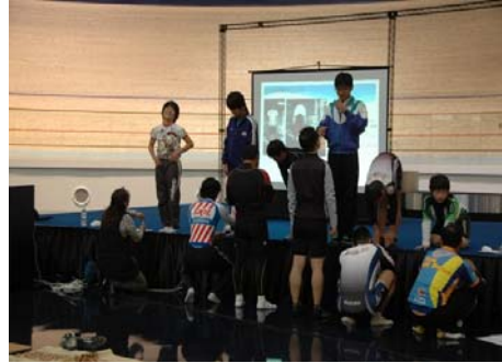
トレーニング専門家による講義