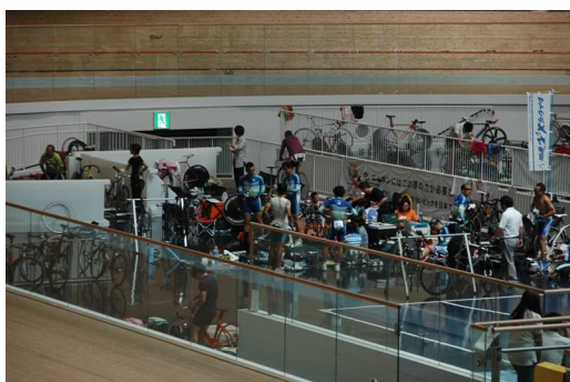
(インフィールド内 待機所)